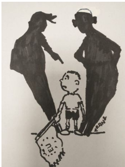
«Necessaria ma non sufficiente» Vignetta di Francesco Fusconi (Franz)

Certo è che alcune domande che i socialisti di allora si posero (con le loro risposte fascinoso ma evasive diedero) sono ancora tutte lì, moltiplicate per dieci, per cento, per mille, in un capitalismo che ha fatto un salto di genere, che non ha più alcun vincolo nazionale alle proprie manovre e per cui il "compromesso democratico" è un inutile impaccio di cui liberarsi. Buon lavoro, dunque, per chi non voglia soggiacervi. ■